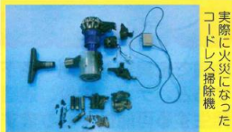
実際に火災になったコードレス掃除機