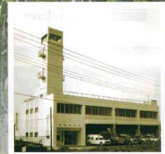
2代目清瀬消防署庁舎