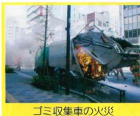
ゴミ収集車の火災

機器購入時に付属されているメーカー指定の充電器やバッテリー(純正品)を使用しましょう。