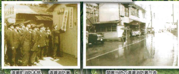
清瀬町消防本部 清瀬消防署 開署当時の清瀬消防署庁舎