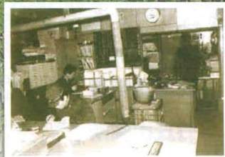
開署当時の事務室 暖房はだるまストーブ