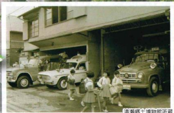
開署当時の庁舎と消防車両